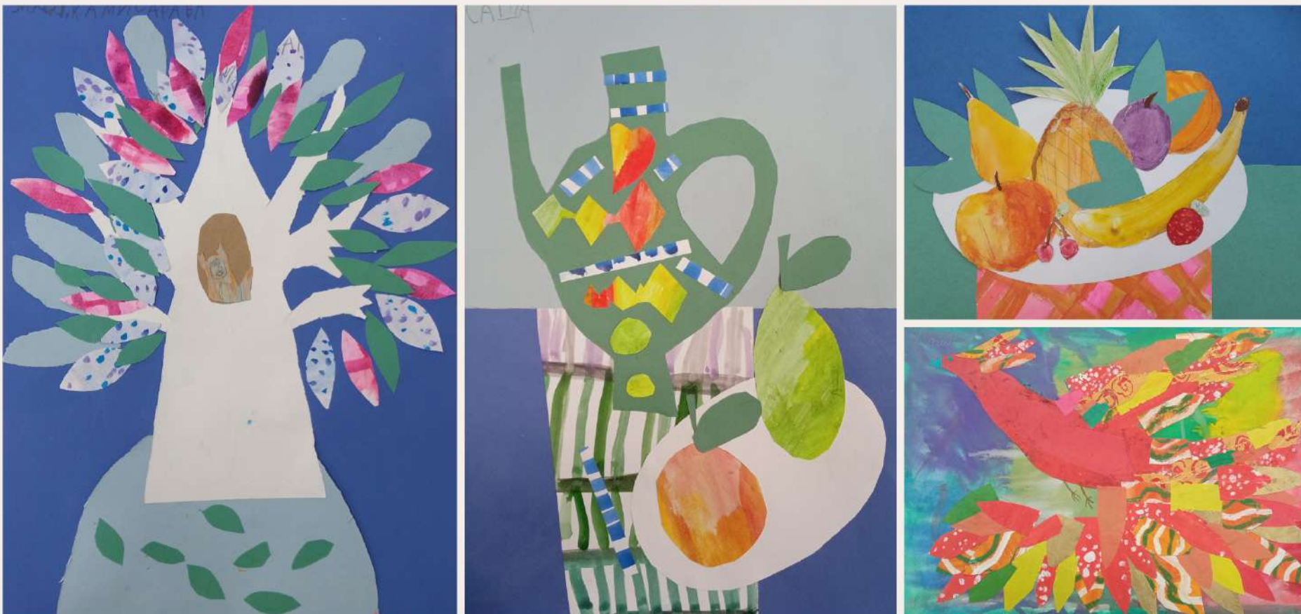
Работы, выполненные в рамках раздела "Аппликация" в 2019-2022 учебных годах

В рамках данного раздела программы обучающиеся осваивают навыки работы с тонированной бумагой и картоном. Изучаются техники плоской, ленточной, обрывной и мозаичной аппликации. Также в раздел включены задания в смешанной технике, объединяющие элементы аппликации, графики и живописи, что дает детям возможность не только закрепить навыки работы с художественными материалами, но и расширить творческий кругозор.