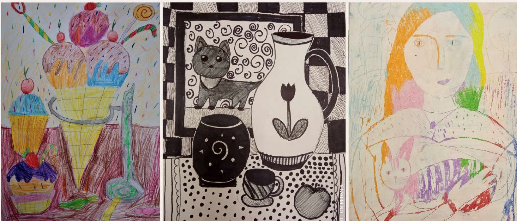
Работы, выполненные в рамках раздела "Графика" в 2019-2022 учебных годах

Задания данного раздела направлены на освоение обучающимися графических материалов: фломастеров и цветных карандашей, гелевых ручек, маркеров, масляной пастели, простого карандаша. Дети знакомятся с понятиями «тон», «силуэт» и «контур». Графические работы выполняются в декоративном ключе с применением штриховки, тональной растяжки, наложения цветов и включением элементов простого орнамента.