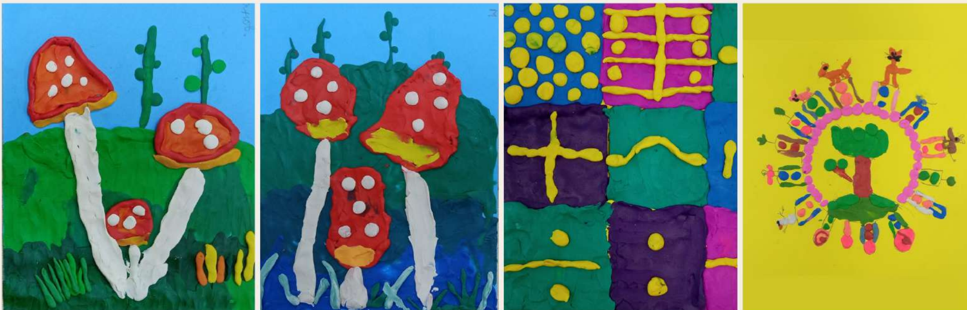
Работы, выполненные в рамках раздела «Лепка» в 2019-2022 учебных годах

Задания из раздела «Лепка» выполняются цветным пластилином. Поскольку к возрасту 6 лет ребенок обычно уже знаком с этим материалом, основной задачей является развитие и углубление навыков, расширение знаний о возможностях пластилина. Изучаются техники пластилиновой живописи и пластилиновой аппликации, выполняются объёмные и полужоёмные композиции.