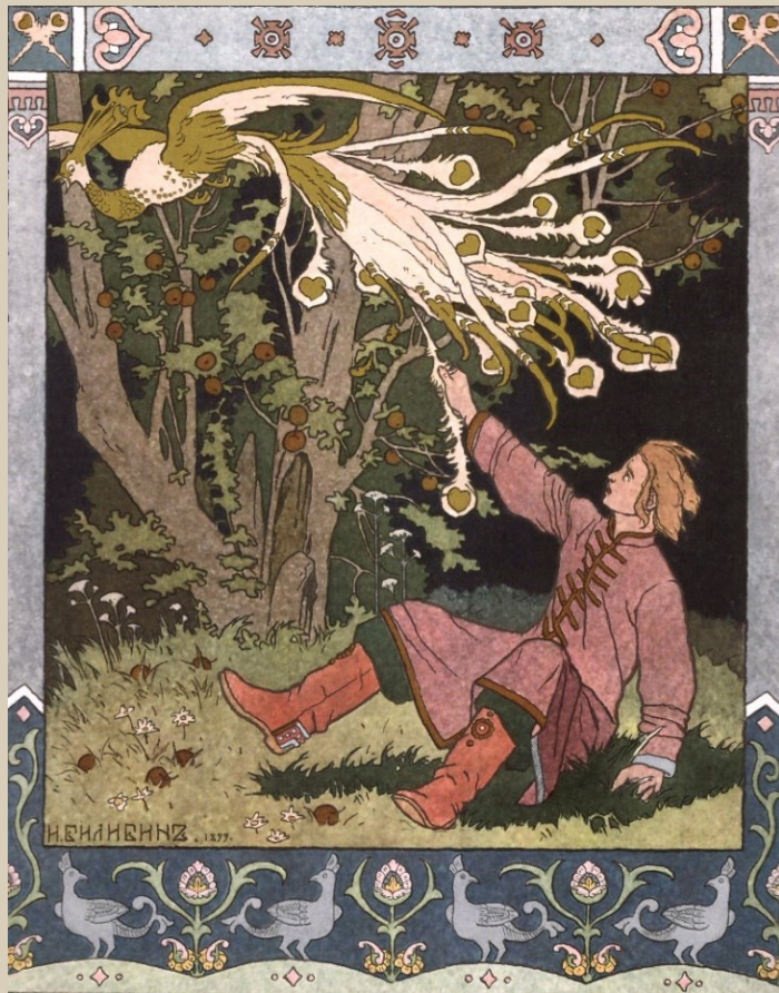
Русская народная сказка