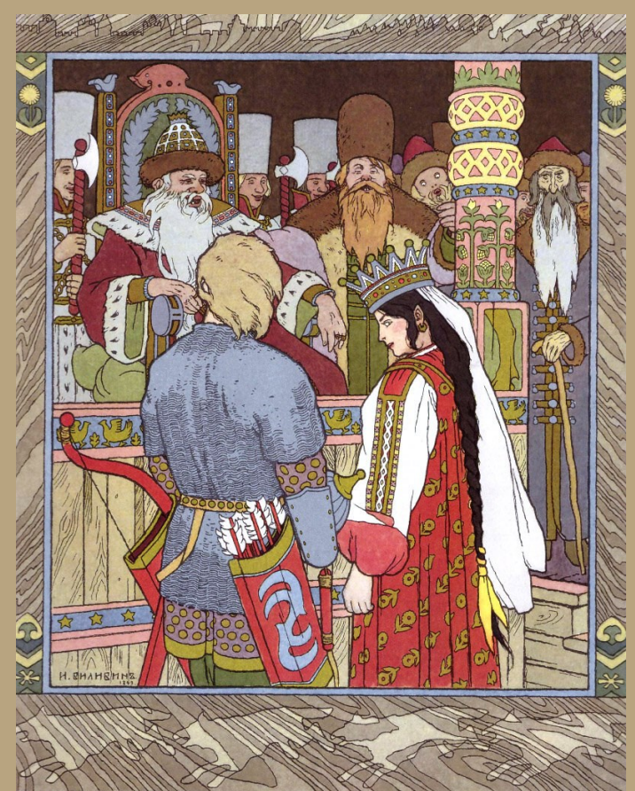
Русская народная сказка