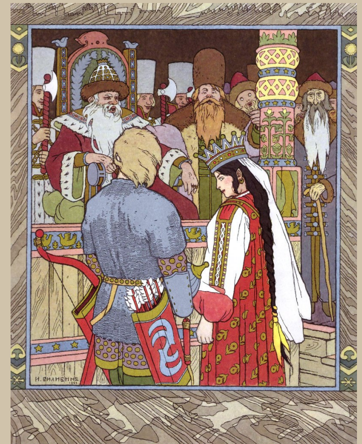
«ЖАР-ПТИЦА И СЕРЫЙ ВОЛК»

Иллюстрации: Билибин создал иллюстрации к «Сказке об Иван-царевиче, Жар-птице и о Сером волке». Проиллюстрировал сказки Александра Сергеевича Пушкина — «Сказку о царе Салтане», «Сказку о золотом петушке» и другие.