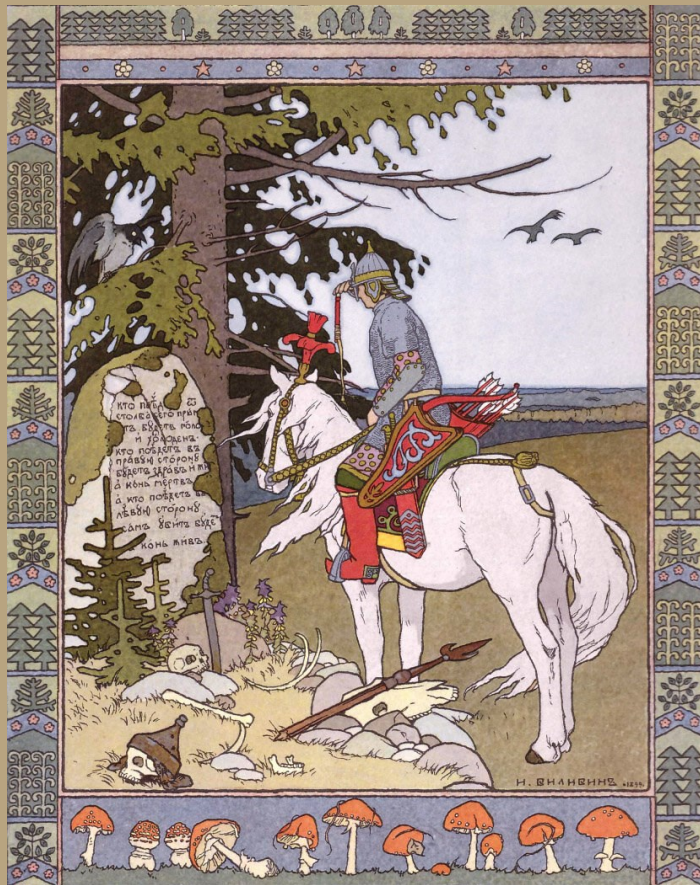
Русская народная сказка