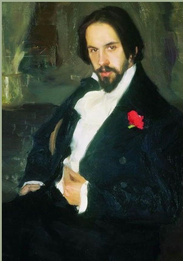
Иван Яковлевич Билибин (1876-1942) художник, иллюстратор, театральный оформитель; участник объединения «Мир искусства»