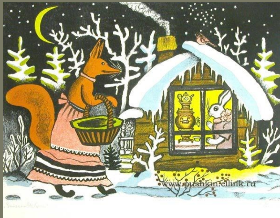
РУССКАЯ НАРОДНАЯ СКАЗКА «ЗАЙКИНА ИЗБУШКА»