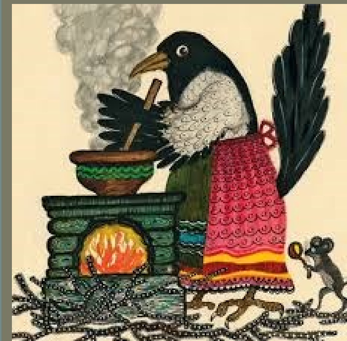
РУССКАЯ НАРОДНАЯ СКАЗКА «СОРОКА-БЕЛОБОКА»

Юрий Алексеевич Васнецов — классик детской книжной иллюстрации, блестящий представитель ленинградской школы графики, создавший свой неповторимый художественный стиль, узнаваемый с первого взгляда. Искусство книги стало его судьбой. Он знал путь от текста к слову, произнесенному цветом, к тексту, преобразенному Художником, его душой, его фантазией.