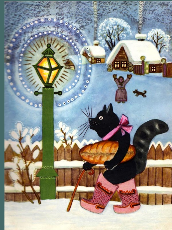
КОШКА В САПОЖКАХ

Книга для детей – увлекательное, многослойное пространство, и «иллюстрации выдающегося русского художника Юрия Алексеевича Васнецова – пример редкой гармонии книжной иллюстрации, игры и художественного текста». Юрий Васнецов создал неповторимые образы, знакомые с детства – книги «Ладушки», «Сорока-белобока», «Краденое солнце», «Небылицы в лицах» и многие-многие другие.