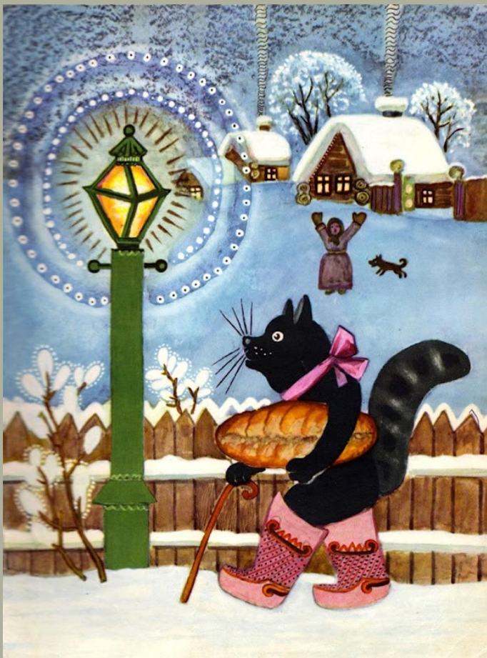
Русская народная сказка