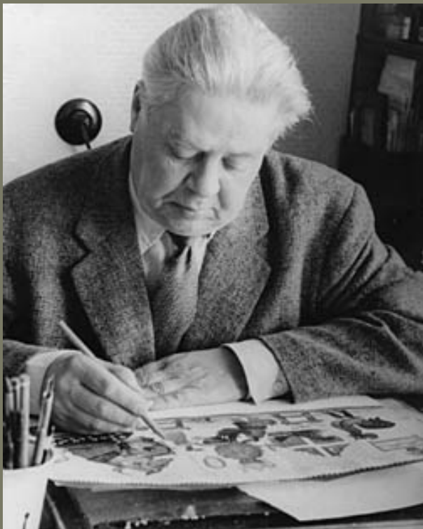
Юрий Алексеевич Васнецов (1900-1973) — русский художник, иллюстратор, график и живописец