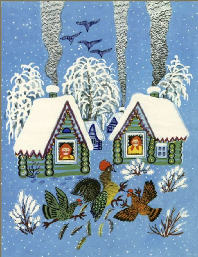
Русская народная сказка