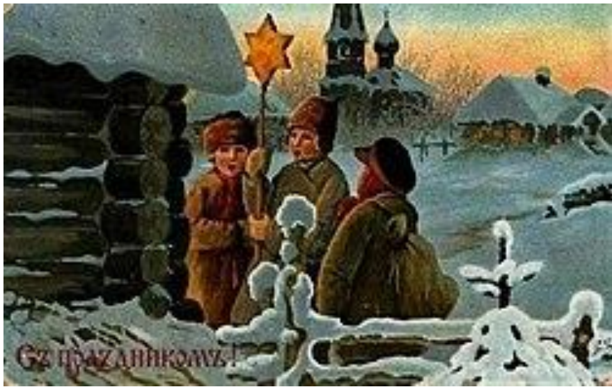
Пение колядок на дореволюционной рождественской открытке