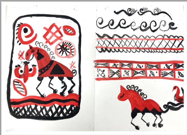
Кистевая роспись, декоративная композиция «Городецкий конь» Бумага, гуашь