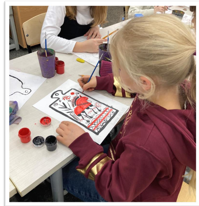
Декоративная композиция «Конь» по мотивам росписи «Мезень»