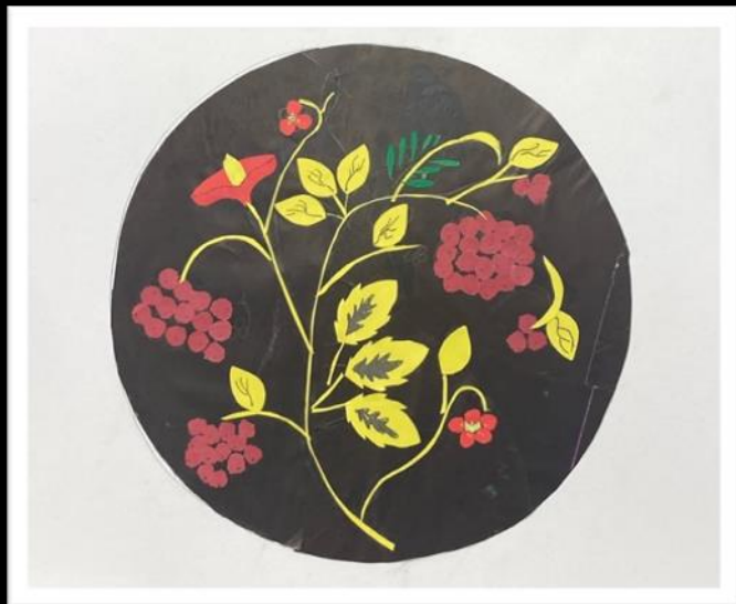
Декоративная композиция «Поднос» по мотивам народной росписи «Хохлома» Цветная бумага, картон