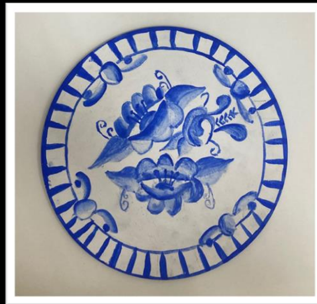
Композиция «Цветы». Кистевая роспись по мотивам «Гжель» Картон, акварель