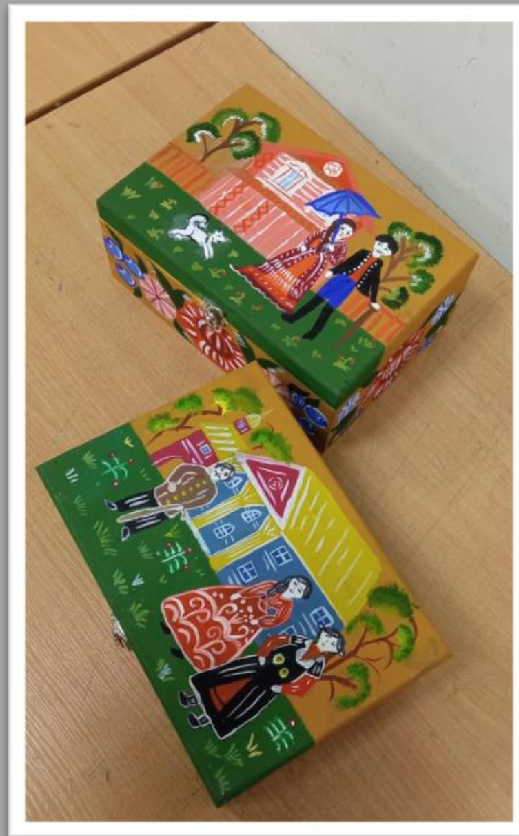
Роспись шкатулки по мотивам «Городец» Дерево, акрил