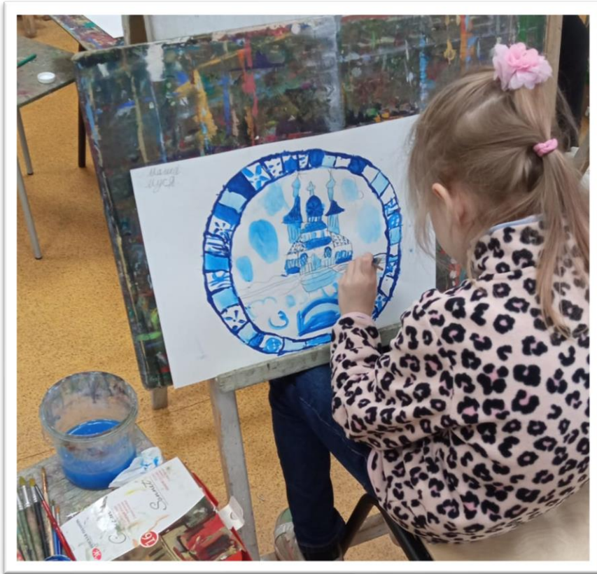
Композиция «Терем» по мотивам народной росписи «Гжель»