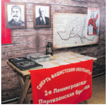
«Партизанский обоз»: выставка в Южном