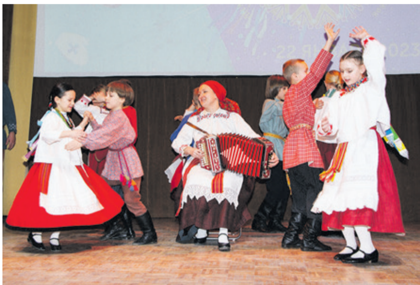
На 11-й фестиваль слетелись участники со всех концов Ленинградской области: 17 самобытных фольклорных коллективов из Лужского, Волховского, Гатчинского и Волосовского районов, Санкт-Петербурга и, конечно, Всеволожского района

и во Всероссийском конкурсе в номинации «Прикладное искусство». Впечатляет!