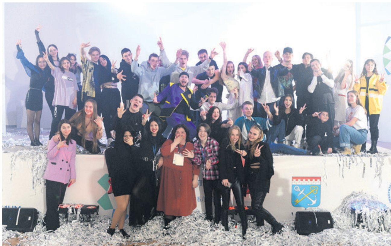
Фото сертоловской гимназии