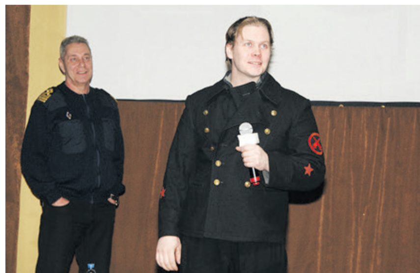
■ Группа «поддержки» режиссёра

Режиссер признается, что и сам не знал об этой истории и услышал о ней случайно, во время рыбалки.