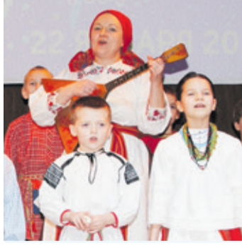
Рождественская круговороть во Всеволожске