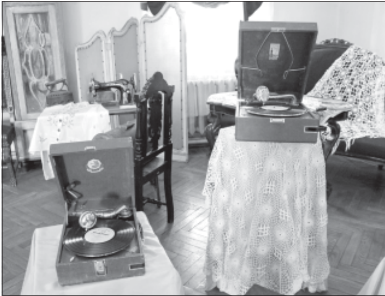
Тихвинский историко-мемориальный и архитектурно-художественный музей работает ежедневно, кроме понедельника, с 10 до 17 часов.

Когда открываешь старинный патефон, то не покидает ощущение, что прикасаешься к самой истории. С первых секунд звучания граммпластинки вы погружаетесь не просто в начало двадцатого столетия, а в дружную эпоху. Это незабываемое путешествие в мир музыки тех лет без регулировки звука.