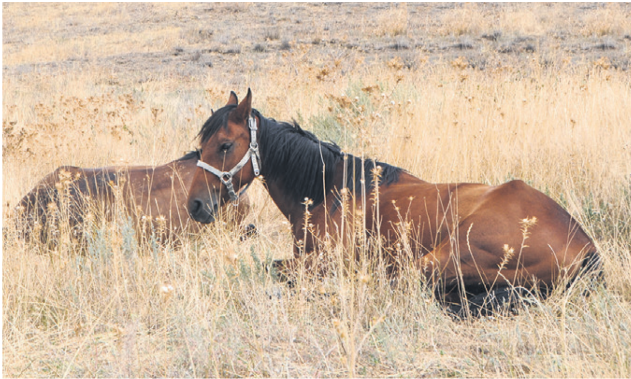
«У кобылы глаза, как земля в сентябре, и соломой запутана грива...»

Приглашаем наших читателей принять участие в выпуске постоянной рубрики «Фотоэюд»*. Присылайте фотографии на почту vsevesti@inbox.ru . В письме не забывайте указать свои фамилию и имя.