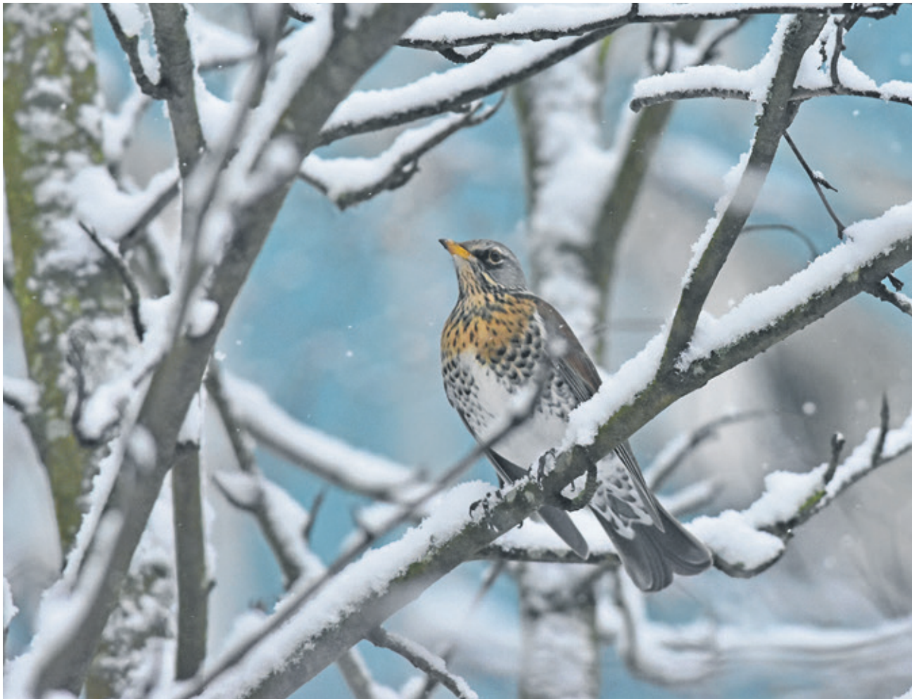
Дрозд-рябинник – птица отважная!