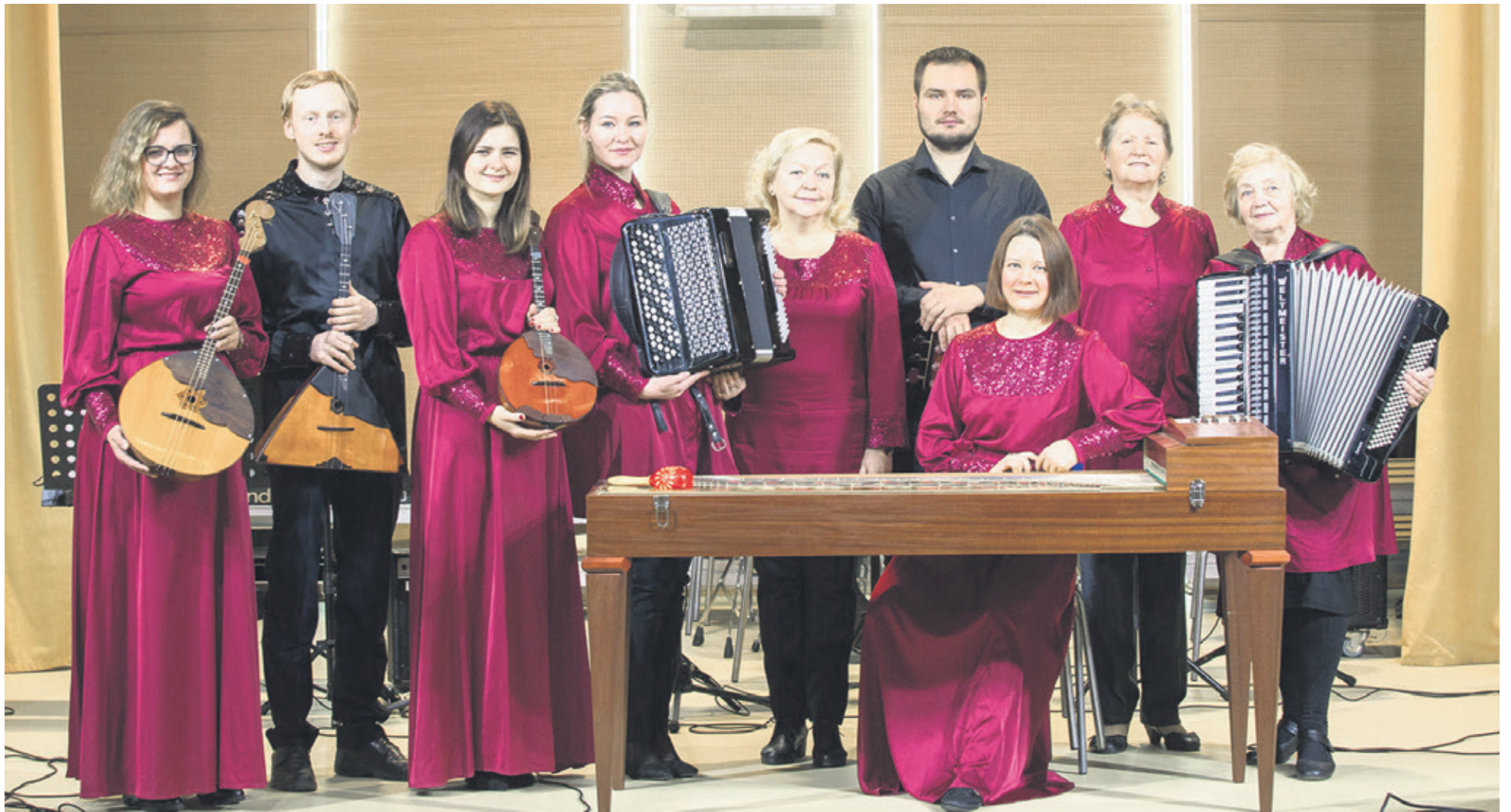
Народный самодеятельный коллектив – ансамбль русских народных инструментов «Садко», созданный педагогами всеволожской Детской школы искусств им. М.И. Глинки 25 лет назад, отмечает юбилей. Трансляция праздничного концерта состоится в конце декабря. Материал читайте на 9-й странице.