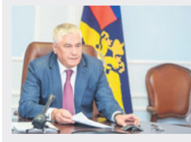
Глава МВД России генерал полиции РФ Владимир Колокольцев, который представлял проект обновлённой Стратегии, сообщил:

Современная наркоситуация в стране оценивается как «тяжёлая». По данным МВД России, в стране регулярно или изредка употребляют наркотики не менее 1,9 миллиона человек. Вектор наркопотребления смещается в сторону синтетических веществ. С 2010 года можно констатировать рост числа лиц с зависимостью от новых психоактивных веществ и полинаркоманией (2018 г. – 63,4 тыс. чел.; 2015 г. – 48,9 тыс. чел., 2010 г. – 26,4 тыс. чел.). Продвигаются новые модели потребления – «клубное», «статусное», «рекреативное», которые, по мнению М.Е. Поздняковой (кандидата философских наук, руководителя сектора социологии девиантного поведения Института соци-