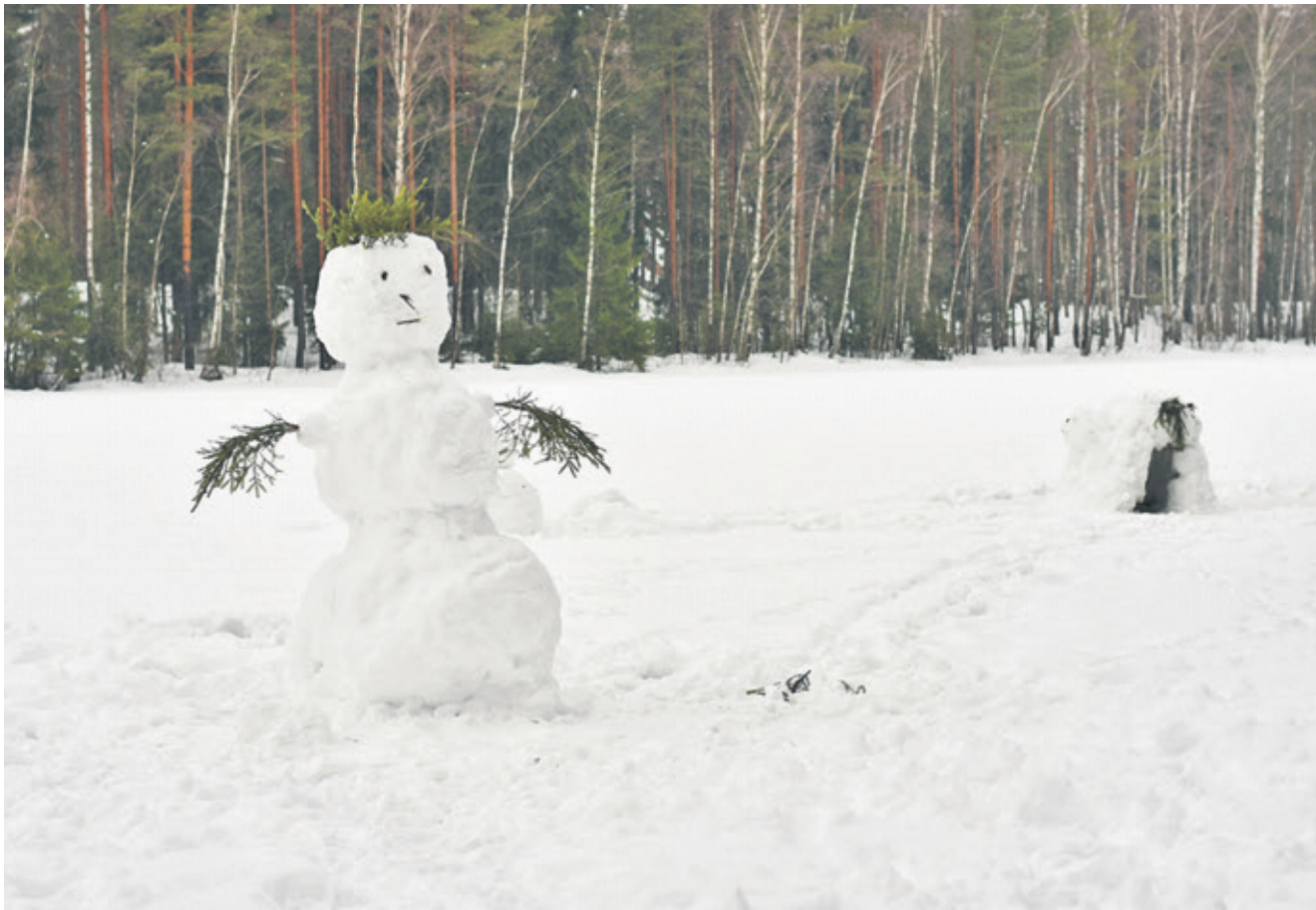
Здравствуй, здравствуй, снеговик! Выпал снег, и ты возник.

Приглашаем наших читателей принять участие в выпуске постоянной рубрики «Фотозтюд»*. Обратите внимание, что адрес почты изменился: sevesti@inbox.ru . В письме не забывайте указать свои фамилию и имя.