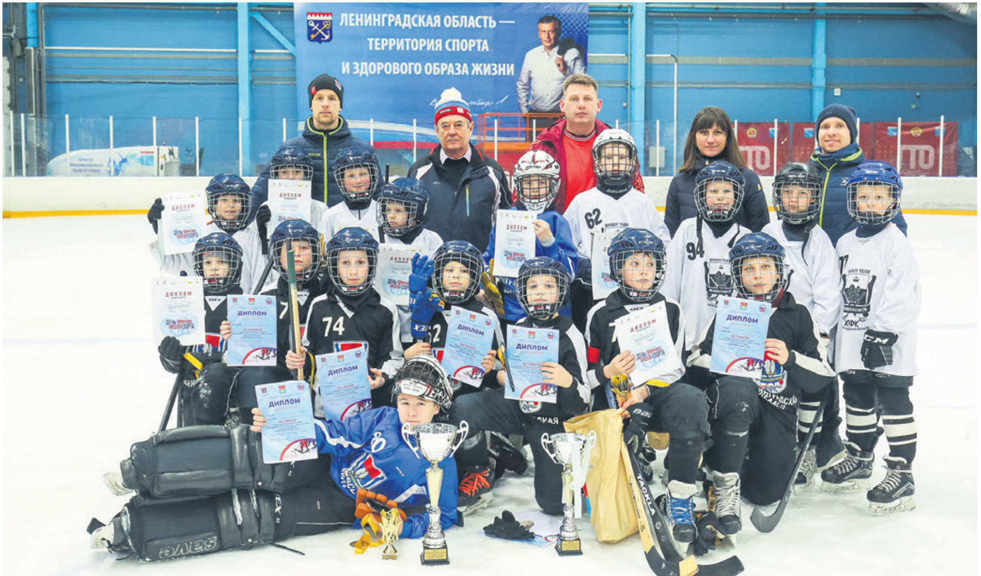
Команда ХФК «Всеволожск» принесла в копилку наград «золото» на первенстве района по мини-хоккею с мячом. В марте она будет участвовать во Всероссийском турнире в Архангельске. Материал читайте на 9-й странице.