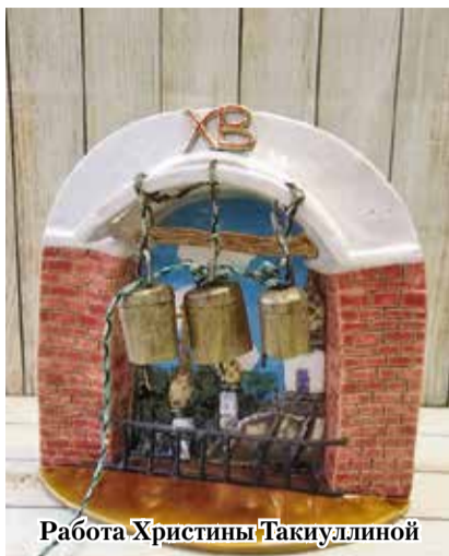
Работа Христины Такиудиной