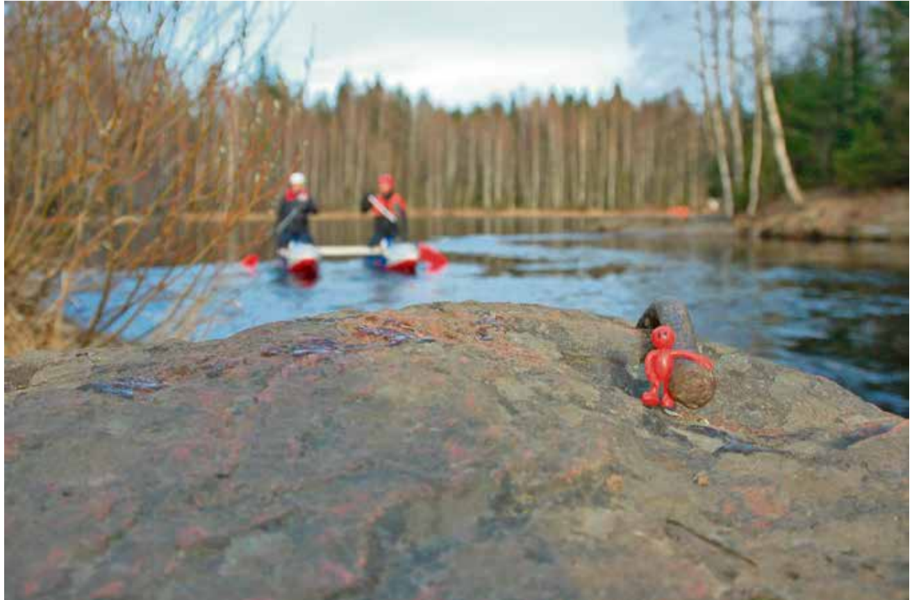
Приключения всеволожского человечка в Карелии