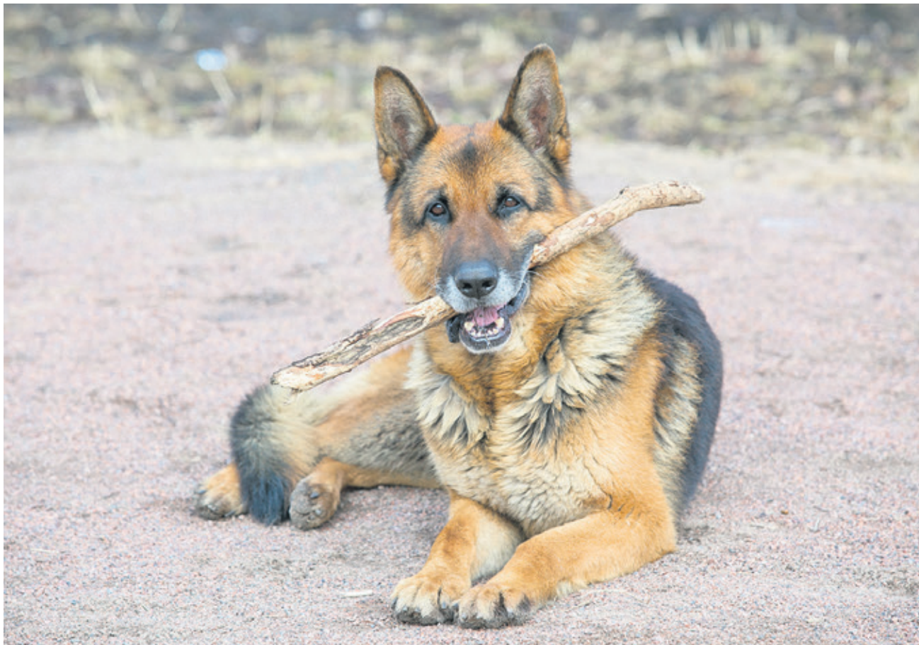
Раз сказал «Не брал», значит, и не отдам!