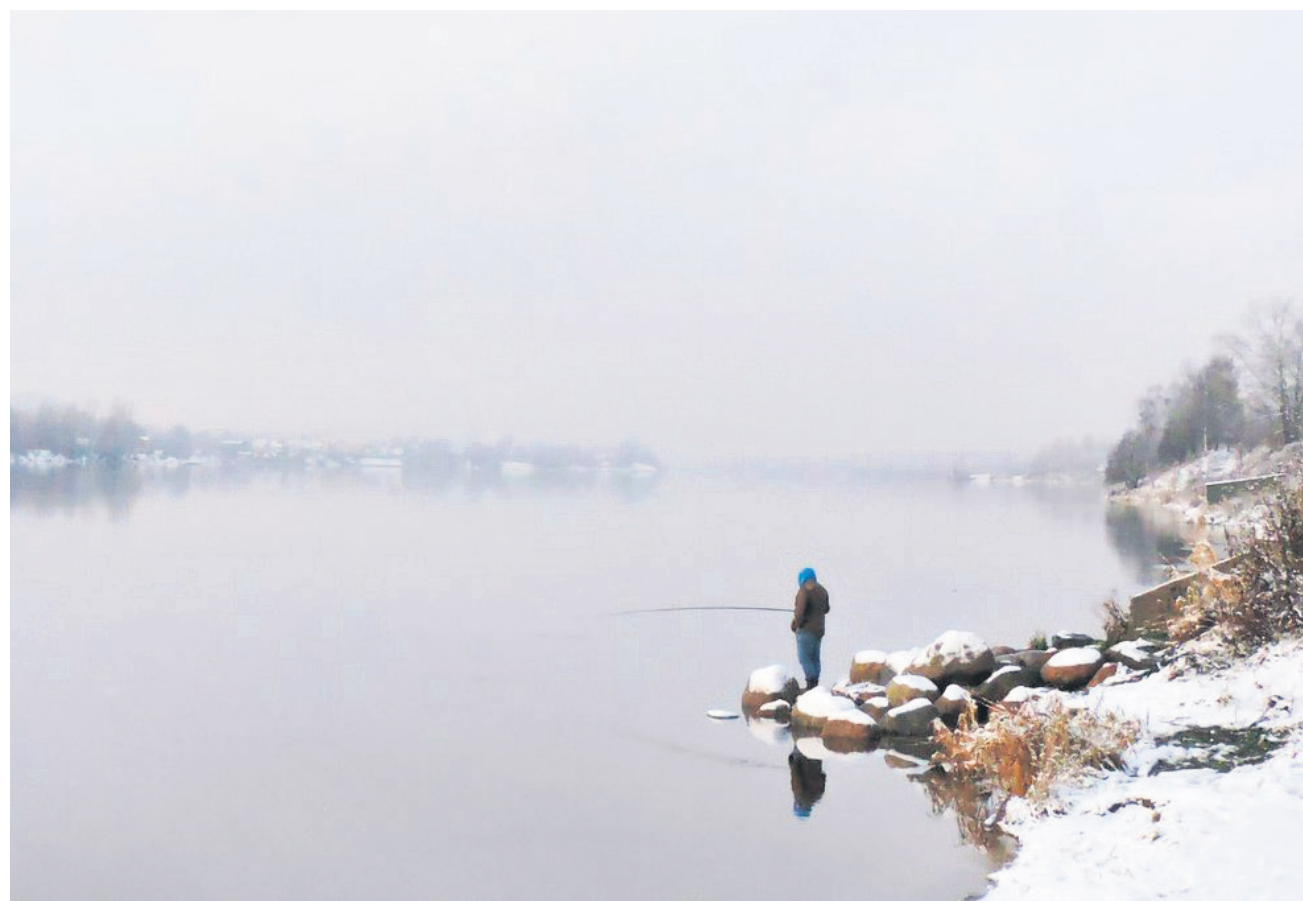
Ловись рыбка, большая и маленькая