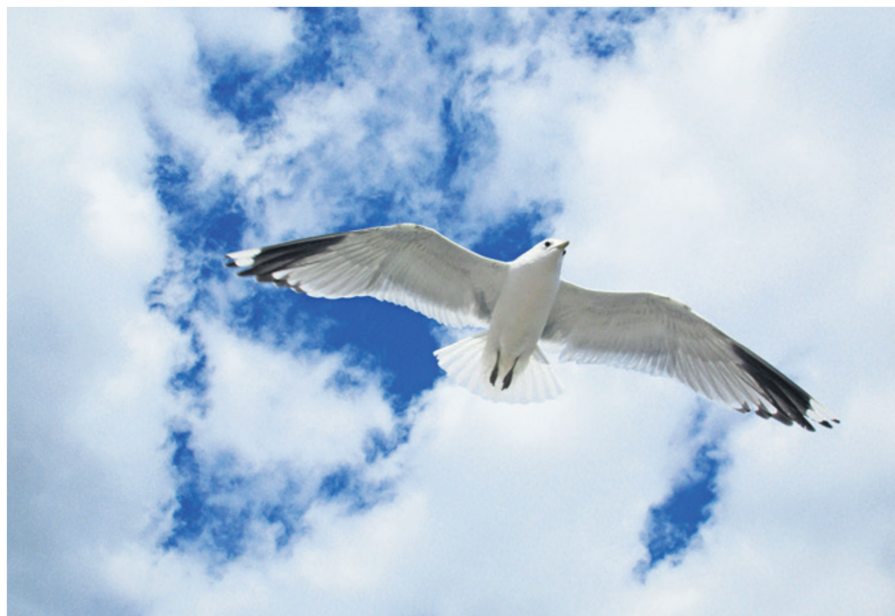
Чайка реет, разрезая седыми крыльями простор