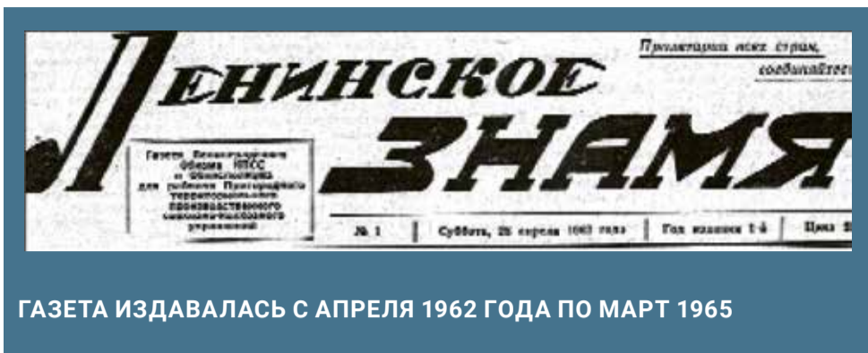
ГАЗЕТА ИЗДАВАЛАСЬ С АПРЕЛЯ 1962 ГОДА ПО МАРТ 1965