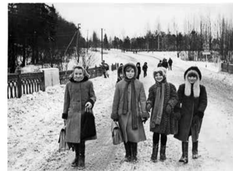
Ученицы Вартемягской средней школы. 1986 г.