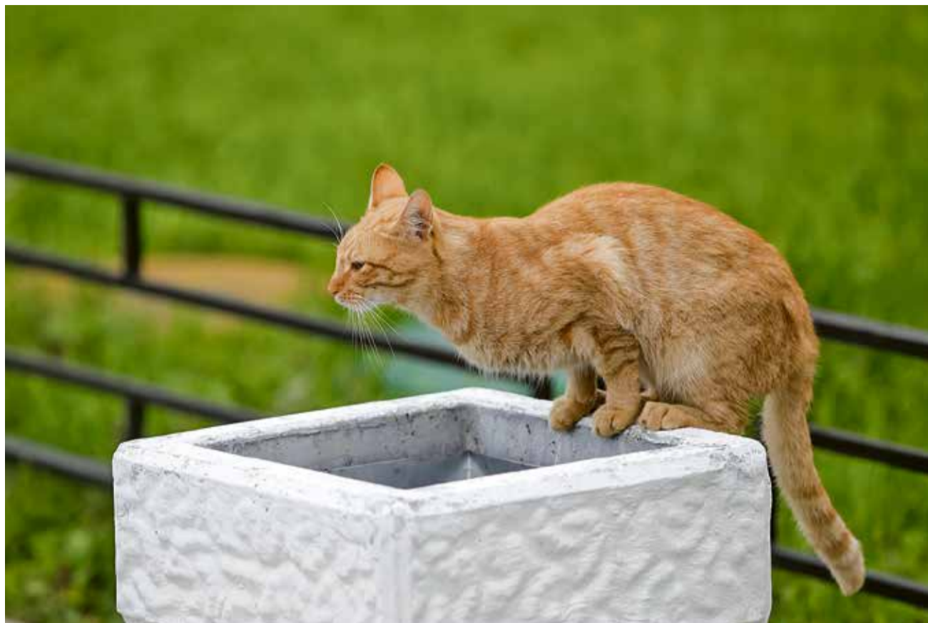
«Домашний или уличный, кот всегда гуляет сам по себе...»