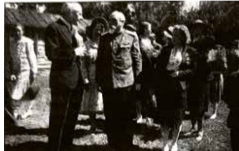
Академик Л.А. Орбели (в центре) дает объяснения профессору Кембриджского университета Эдриану (слева) во время посещения биологической станции в Колтушах (Павлово). 28 июня 1945 г.