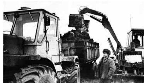
Сельхозработы в совхозе «Бугры».

Более 10 тысяч студентов приедут летом на помощь труженикам сельского хозяйства области. Студенческие отряды «Карелия», «Балтика», «Ладога» и другие примут участие в совхозном строительстве. В сельском хозяйстве нашего района будут работать несколько групп интернациональной молодежи.