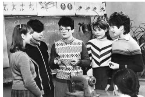
Учебно-производственный комбинат: занятия по машиноведению. 1985 г.