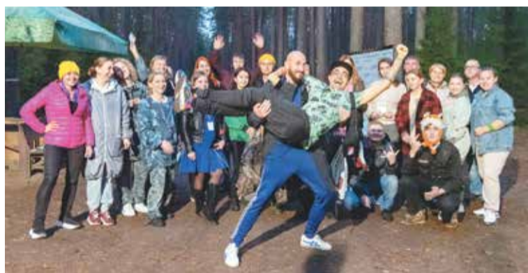
Медиакоманда 47 региона