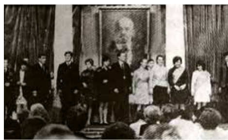
Лучшие представители молодежи Всеволожского района во время слета сельскохозяйственной молодежи района. 1973 год.