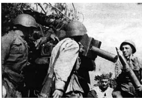
Орудийный расчёт на огневой позиции во время боя. Невская Дубровка. 1943 год.