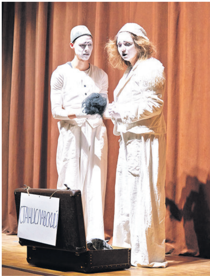
На церемонии открытия выступили почётные гости – профессиональные актёры из «Театра имени Которого Нельзя Называть»

В первый же день в микрорайоне Южный было показано несколько конкурсных спектаклей. Их оценивало компетентное жюри. Достаточно