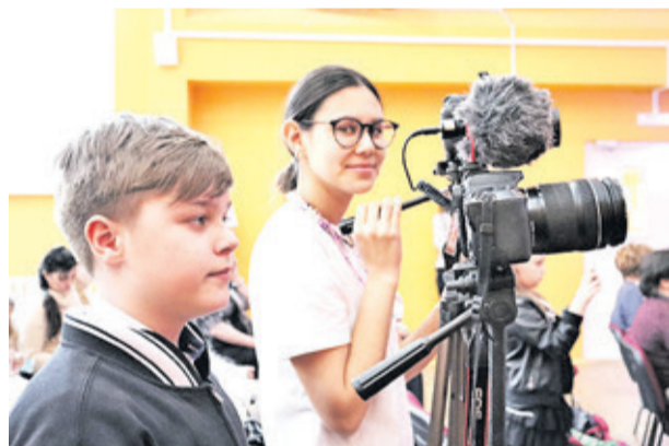
Медиацентр гимназии в Сертолово «Три кита» стал лучшим в Северо-Западном федеральном округе.

Как сообщает пресс-служба областного правительства, акция «Мое детство – война» стартовала в 2020 году. За полтора года был создан видеоархив, содержащий воспоминания более трех тысяч человек, чье детство пришлось на годы Великой Отечественной войны. Только за минувший год архив пополнили свыше 600 новых видеозаписей.