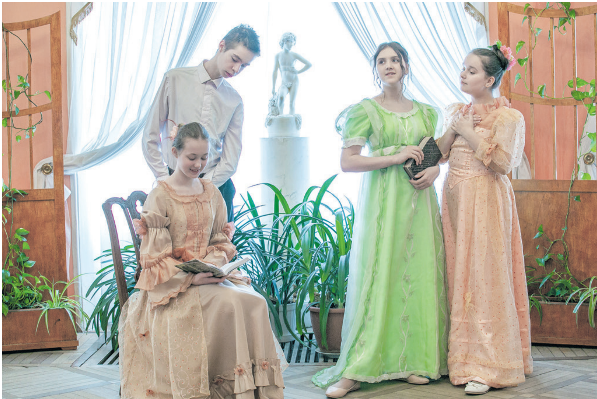
«Теперь с каким она вниманием читает сладостный роман...». Сцена из театральной постановки Образцового детского коллектива «Люди и куклы» (ДДЮТ) в Музее-усадьбе «Приютино».