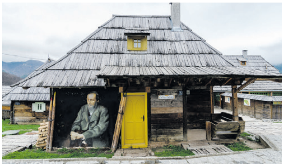
В деревне Дрвенград

Подготовила Татьяна ТРУБАЧЕВА