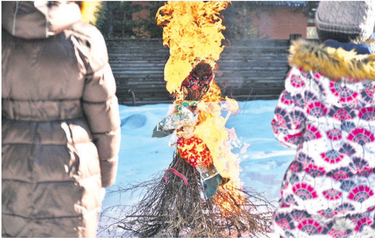
Прощание с зимой