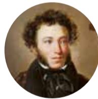
ПУШКИН АЛЕКСАНДР СЕРГЕЕВИЧ (06.06.1799–10.02.1837)

В 1804 – 1808 гг. служил в лесном департаменте. Первая пьеса Озерова – трагедия «Ярополк и Олег» (1798). Стихотворные трагедии «Эдип в Афинах» (1804), «Фингал» (1805), «Дмитрий Донской» (пост. 1807), «Поликсена» (1809). В 1806 – 1808 гг. Озеров гостил в усадьбе А.Н. Оленина в Приютино.