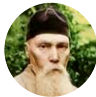
РЕРИХ НИКОЛАЙ КОНСТАНТИНОВИЧ (09.10.1874–13.12.1947)