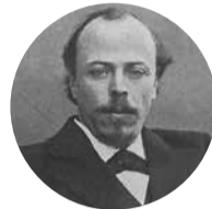
НЕСТЕРОВ МИХАИЛ ВАСИЛЬЕВИЧ (31.05.1862–18.10.1942)

Мы продолжаем публиковать материалы сборника «Истоки» об известных исторических личностях, побывавших в наших краях. Начало в № 32 от 30 апреля.