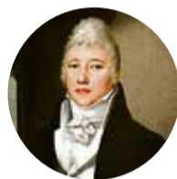
ОЗЕРОВ ВЛАДИСЛАВ АЛЕКСАНДРОВИЧ (11.10.1769–17.09.1816)

Создал поэтические религиозные образы, связанные с этическими исканиями 1880 – 1910-х годов. («Видение отроку Варфоломею», 1889 – 1890, «На Руси», 1916). Писал глубокие, острохарактерные портреты деятелей отечественной культуры. Два раза был приглашен в Колтуши писать портрет И.П. Павлова (июль 1930 г., 1935 г.).