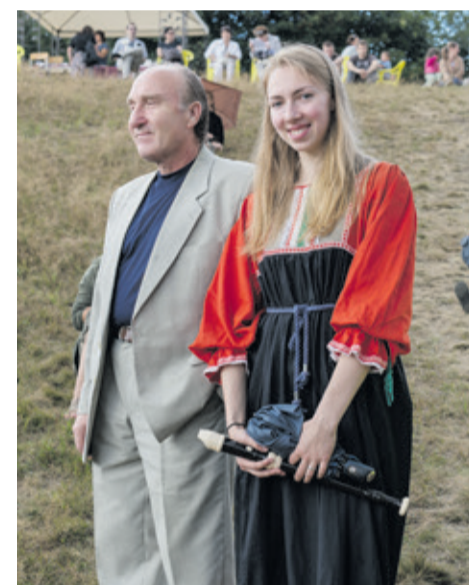
«Музыка на воде». 2015 год