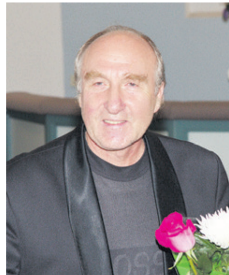
После концерта в Германии

– Это же очень просто! Патриотизм никакого отношения к политике не имеет. Настоящий патриот – это простой человек из народа. Это Иван Сусанин. Или герои Севастополя, или те, кто защищал Бородину. Вот настоящие герои – те, кто сражался за Отечество.