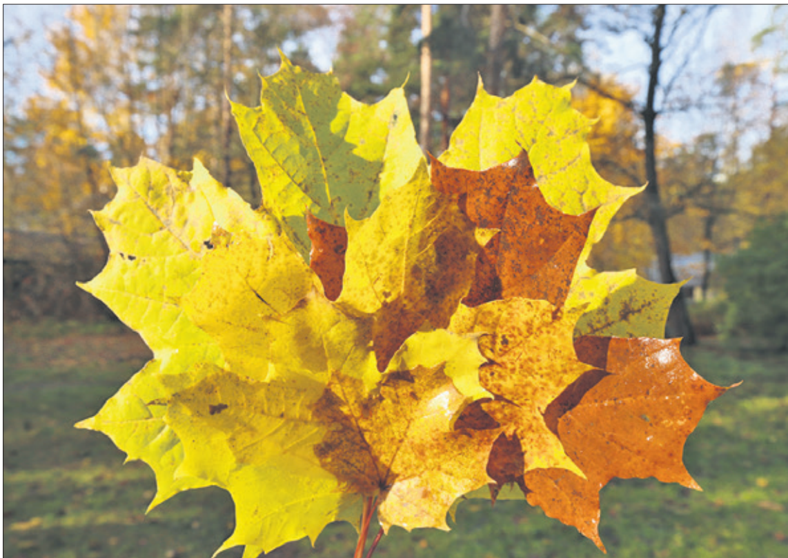
Ходит осень, бродит осень. Ветер с клёна листья сбросил.