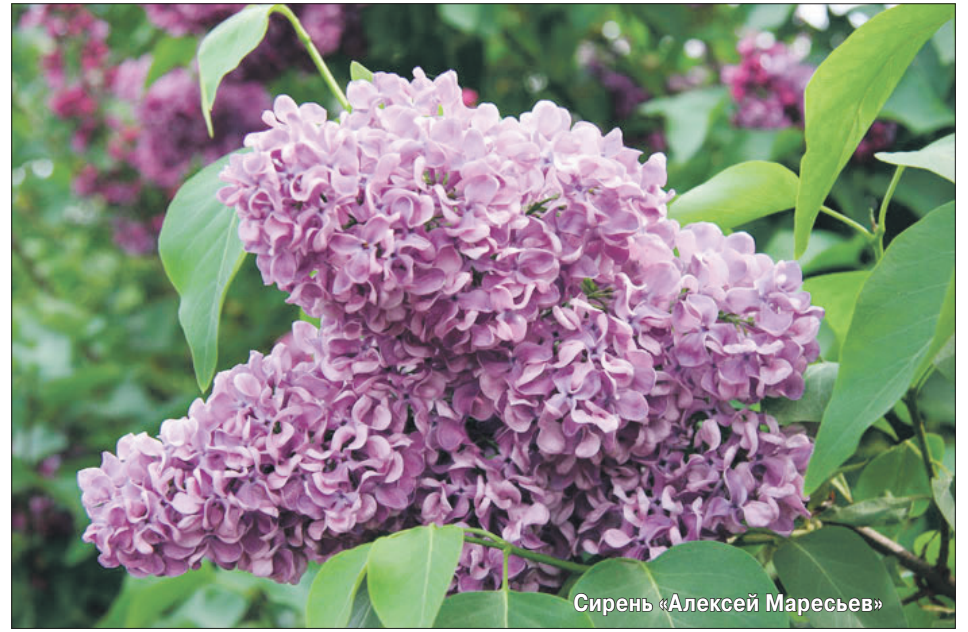
Сирень «Алексей Маресьев»