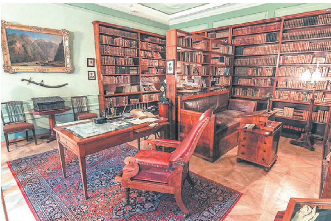
Рабочий кабинет А.С. Пушкина в квартире в Санкт-Петербурге на Мойке, 12.

ратурный язык, не выдумав ни единого слова. Пушкин, образно говоря, «раскрутил» русский язык, выявил его потенциал, показал его безмерное богатство. Он, как никто, научил нас говорить по-русски, сформировал наше языковое сознание. И звание основоположника русского языка по праву принадлежит ему. А что мы? Как распорядились этим богатством!? Ни для кого не секрет, что наш русский язык оказался перед лицом агрессивного воздействия иноязычных стихий. Мы являемся свидетелями того, что первое, с чем начинают бороться враги России, – это русский язык.