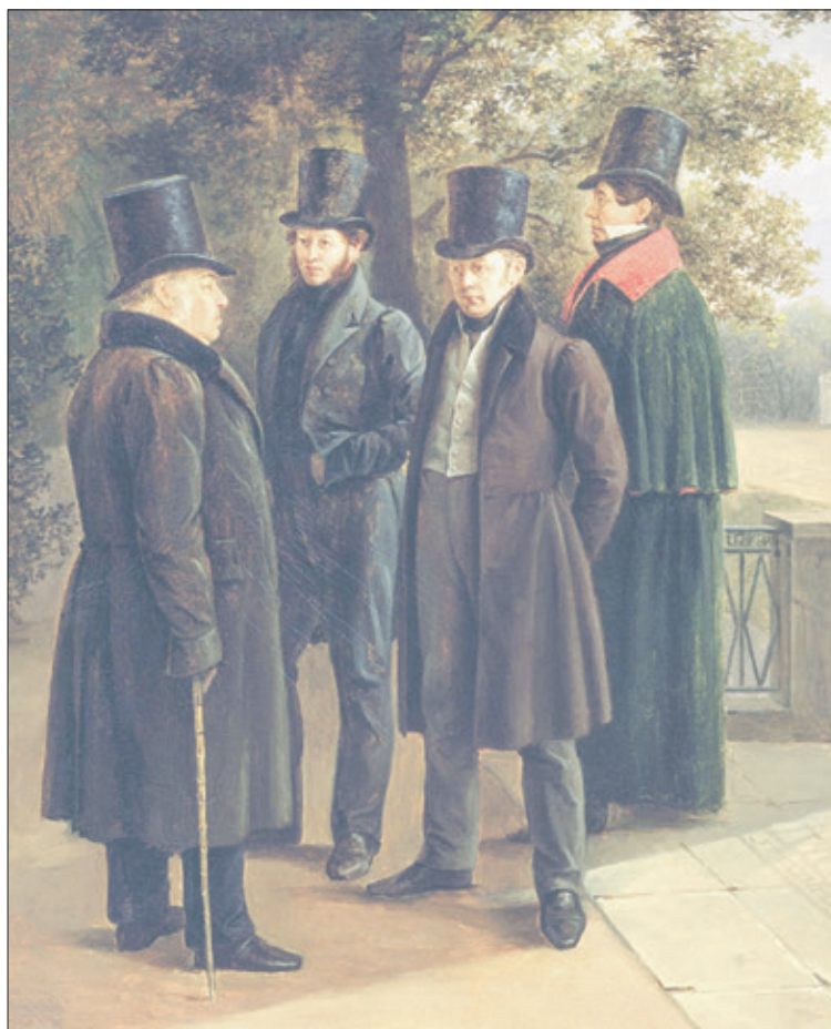
Крылов, Пушкин, Жуковский и Гнедич в Летнем саду. 1832

ский сказал: «Слово – полководец человечей силы!» И что же мы видим в наше время, когда при помощи электронных и печатных СМИ, а особенно Интернета, словом разрушают государства и убивают миллионы людей. К примеру, сказал некто, что у Ирака есть химическое оружие, и полетели бомбы на головы мужчин, женщин и детей. То же в Югославии, Сирии и далее