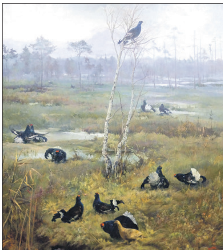
Картина А.А. Блинова

форумы в Ленинградской области заполнены сообщениями о том, как волчьи стаи заходили прямо в деревни, загрызали домашних собак, сидящих на цепи. И вообще, несмотря на то, что отстрел волков производится регулярно, зимой у нас не рекомендуется уходить далеко в лес по тропинкам.