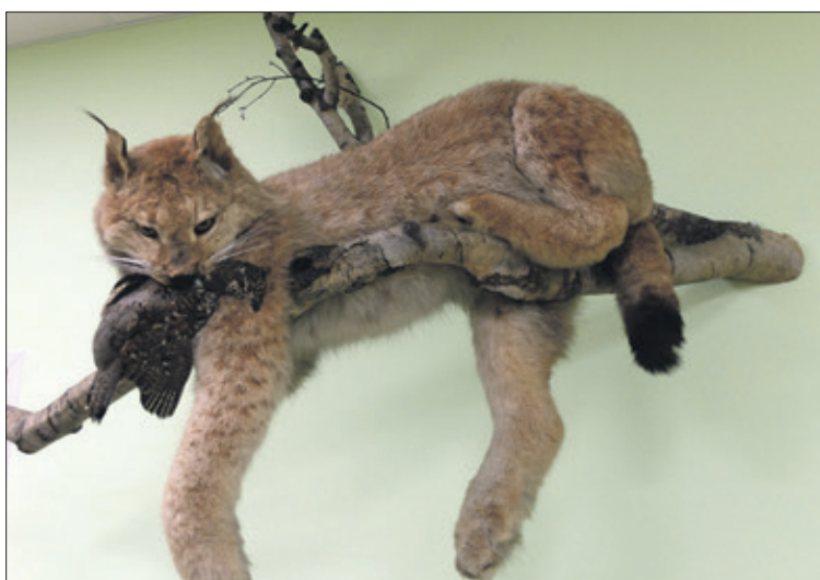
Экспонаты Музея леса

Людмила ОДНОБОКОВА Фото автора и из открытых источников