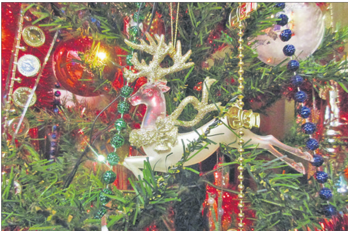
«Умчи меня, олень, В свою страну оленью...»