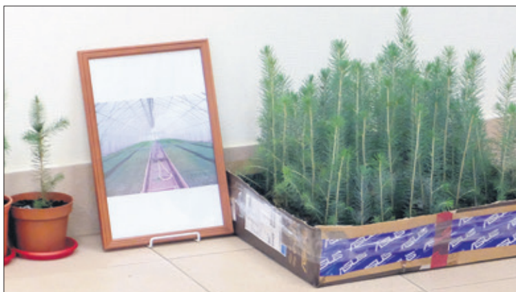
Из этих саженцев вырастет лес

Приезжал Александр II со своей свитой и в Токсово. Для него был построен небольшой охотничий домик (до наших дней не сохранился). Но, конечно, больше всего император любил Новолисино. В этом образцово-показательном учебном охотничьем хозяйстве были прекрасные фазаны ремизы, птицы павильоны – всё было устроено на высшем уровне. И император приказал отстроить в Новолисино целый Охотничий дворец.