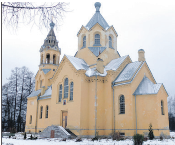
Храм Н.Л. Бенуа в Новолисино

Мы остановимся на одной из историй. В 1803 году в Санкт-Петербурге был создан первый Лесной институт и первая научная лаборатория. А 7 декабря 1834 года министр финансов Егор Францевич Канкрин издал указ, чтобы было создано учебное лесное хозяйство, именуемое – «Учебное лесничество». Оно было предназначено для того, чтобы студенты Лесного института проходили практику. Под Учебное лесничество была выделена территория площадью в 28 500 гектаров вблизи деревни Новолисино, и эта огромная территория сохраняется до сего дня. С 1986 года это – Лисинский заказник, на