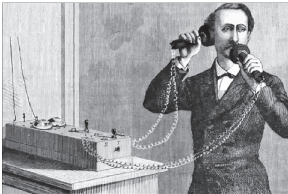
Демонстрация телефонного аппарата Белла в 1877 г.

В результате стихийного бедствия погибло более 25 тысяч человек, около 19 тысяч стали инвалидами, лишились крова 530 тысяч армян. Были полностью разрушены город Спитак и 58 сёл. Частично разрушены города Ленинакан, Степанаван, Кировакан и ещё более 300 населённых пунктов. Пострадали здания школ, детских садов, больниц, театров, музеев, библиотек, кинотеатров и домов культуры. 600 км автодорог и 10 км железнодорожных путей были выведены из строя, разрушены 230 промышленных предприятий. Для оказания помощи пострадавшим во