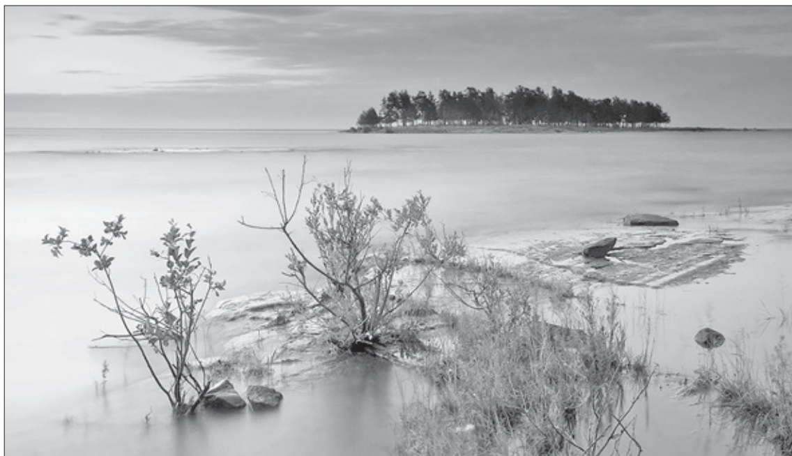
Иногда загадочно выглядят и острова Валаама

В святочные дни многие мечтают о чуде. И особенно приятно вспоминать о чудесах, которые произошли в реальной, невыдуманной жизни. Одно из таких чудес случилось у меня и ещё у двух человек, которые в тот момент находились рядом. Можете этих людей разыскать и спросить, так ли это было.