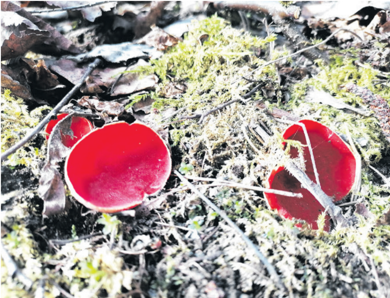
Первые грибы весеннего леса